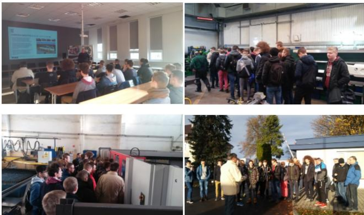
wizyta w firmie FM Bumar S.A.