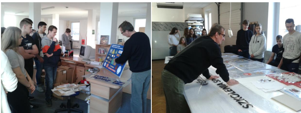
wizyta w Agencji Reklamowej REPRO