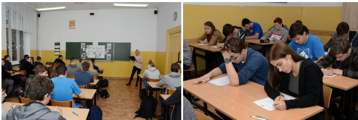
szkolny etap konkursu „Poznaj swoje prawa w pracy”