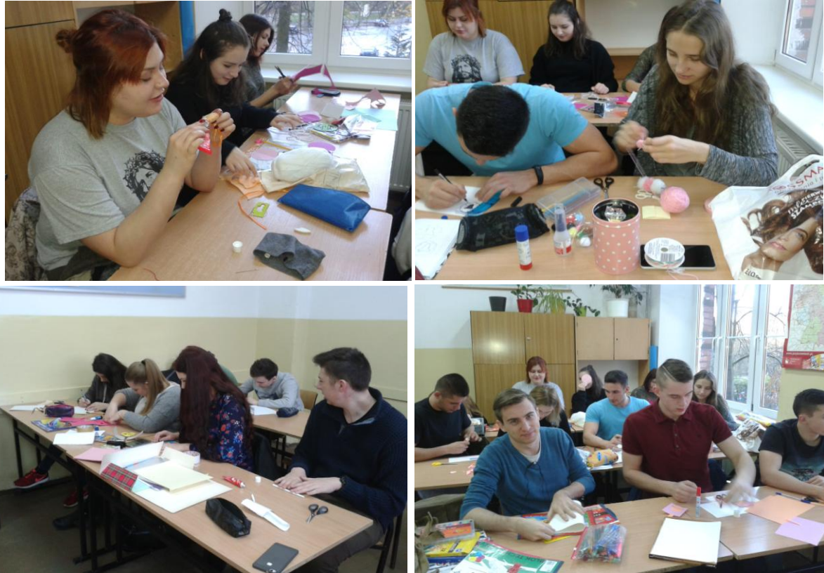
praca uczniów klasy 4tor.