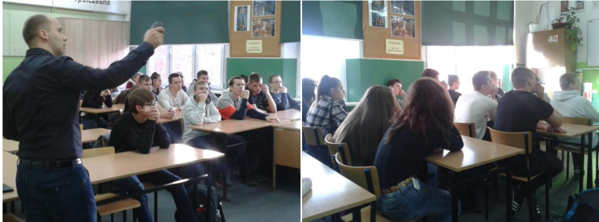
spotkanie uczniów z firmą Doris Spa.